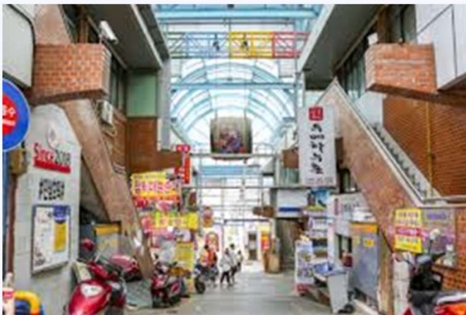
전통시장 맛집, 특산품 등을 소재로 브랜드 게임 개발

이로써 관광객은 단순한 '방문자'가 아닌 콘텐츠 속 주인공이자 창작 스토리의 일부가 됩니다.