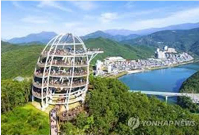
전통적인 지역관광지를 소재로 논픽션 게임 개발