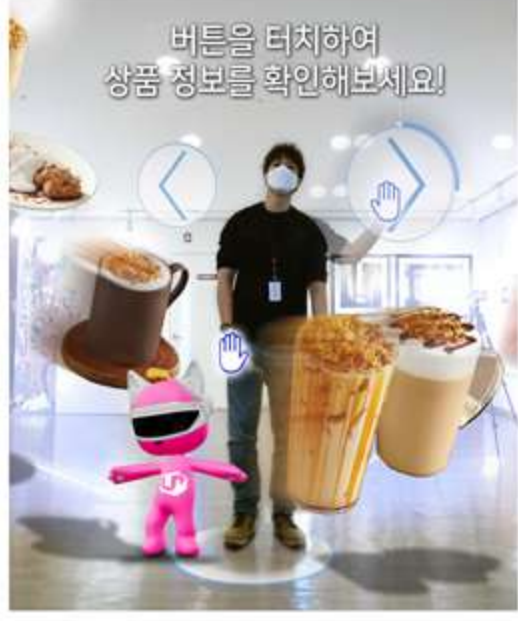
접촉 및 비접촉 감응 제품 검색 및 3D 데이터를 이용한 제품 소개