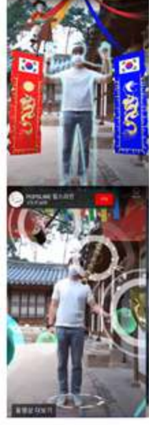
사용자 인터랙션 콘텐츠 기능 (게임, 이벤트 등)