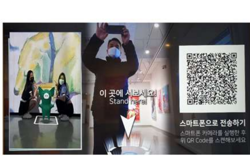
기업 캐릭터(또는 제품, IP등) AR과 사진을 촬영하고, 공유할 수 있는 기능