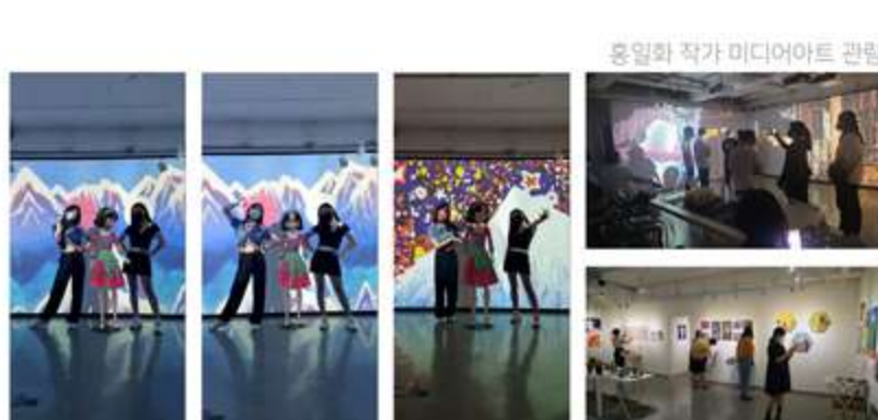
미디어아트에서 XR캐릭터와 함께 핸드폰 사진촬영 | 일러스트 갤러리XR 아트페어

미디어아트를 통해 작가 전시회, 세미나, 관광객 특별 초대전 등 보다 더 다양한 관광객 유치 프로그램 운영 가능